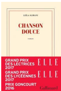
UNE CHANSON DOUCE

En raison de ses échecs répétés, l'existence du département V est menacée. Rose doit montrer que le service vaut encore quelque chose, mais elle se retrouve internée, en proie aux fantômes d'un passé violent. D'un autre côté, de nombreux crimes ont lieu à Copenhague. Carl, Assad et Gordon devront empêcher les nouveaux crimes en préparation.