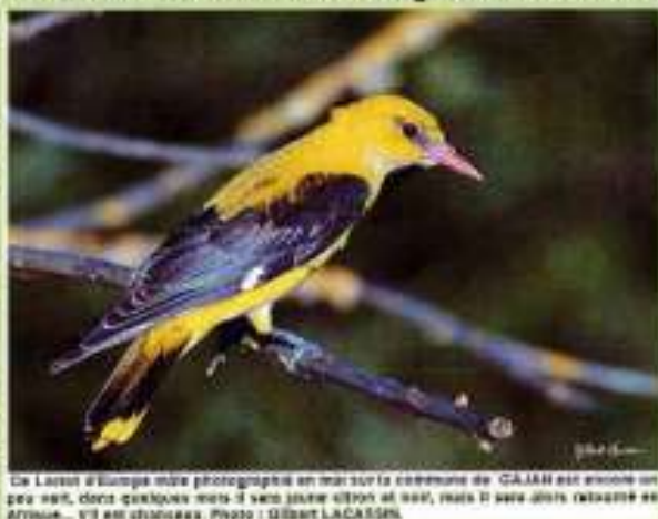
Ce Lézard d'Europe m'a photographié en mai sur la commune de CAJARI en avion un peu haut, donc quelques mois à son tour d'être au sol, mais il sera alors rétrogradé en Afrique... c'est en oiseaux.

Gilbert Lacassin. téléphone : 06 33 98 75 38 courriel : g.lacassin@laposte.net