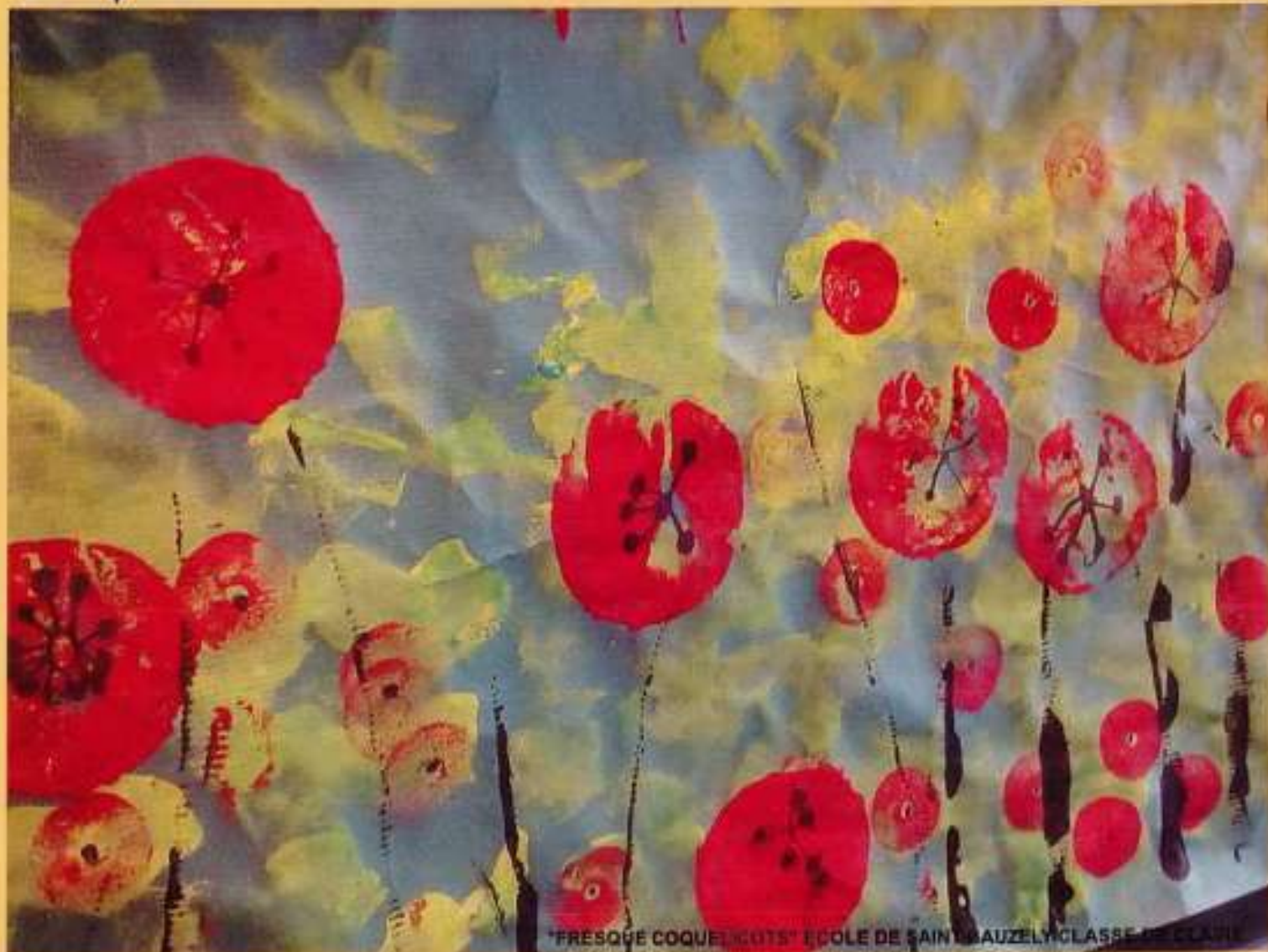
"PRESQUE COQUELICOTS" ÉCOLE DE SAINT BAUZELY CLASSE DE CLAIRE