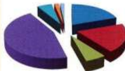
Dépenses de fonctionnement