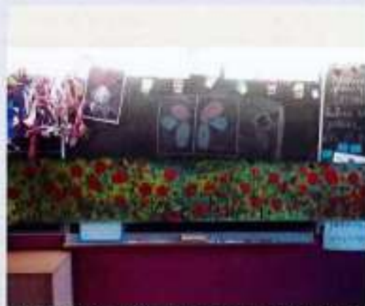
"Merci aux enfants de l'école de Saint Bauzely pour leur participation à l'illustration de cet article. L'école de coquelicots - Trésor collectif"

Merci à l'école de Saint Bauzely pour la création d'une fresque de coquelicots (photos et projet : Claire RAYNAUD)